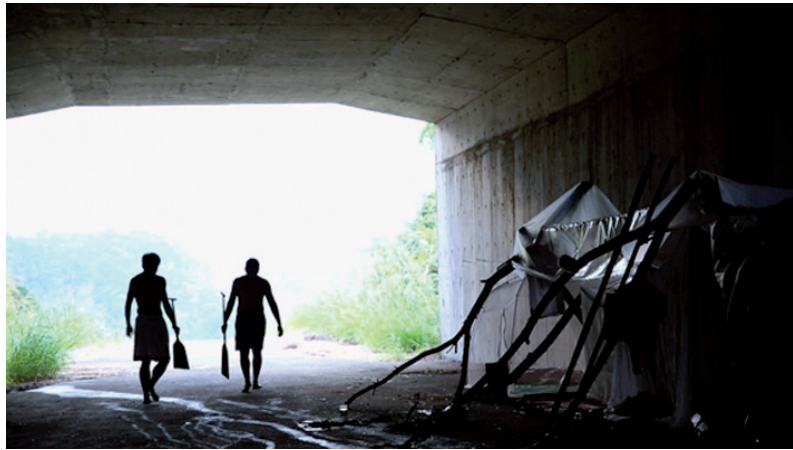
After Reality , 2013 video still