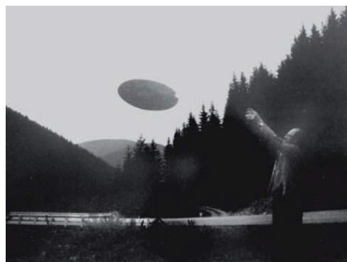
Julius Koller Demonstrative Cultural Situation 1,2 (U.F.O.) , 1989 photographies noir et blanc 30 x 40 cm chacune collection Kadist Art Foundation