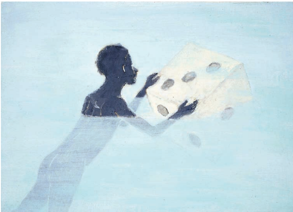
Francis Alÿs, Sans titre , 2007